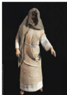
Een arme vrouw