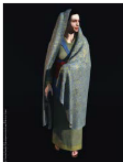
Een rijke vrouw